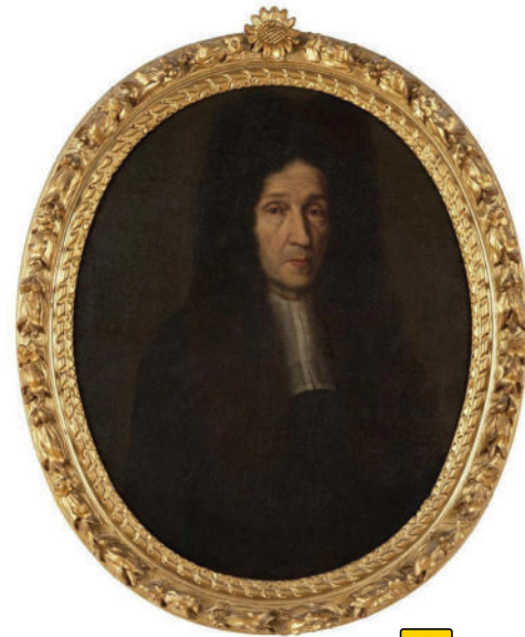
Le chancelier Georges de Montmollin

Pour illustrer notre propos, nous nous appuyons sur différents dossiers conservés dans les archives privées de la famille Montmollin 3 .